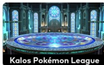
Kalos Pokémon League