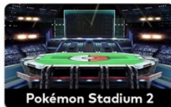
Pokémon Stadium 2