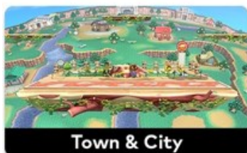
Town & City