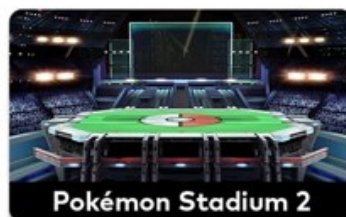
Pokémon Stadium 2