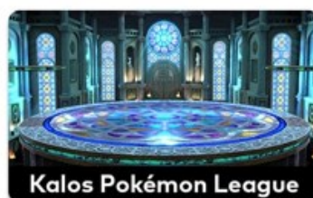
Kalos Pokémon League